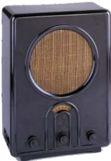
Volksempfänger Typ VE 301 Preis: 65 Reichsmark

Das Radio, heute als "Nebenbei-Medium" bezeichnet, war Anfang des 20. Jahrhunderts eine technische Revolution. Damals begann man Nachrichten drahtgebunden zu übermitteln, bald aber drahtlos. Dem italienischen Radiopionier Guglielmo Marconi wird der Löwenanteil an der Entwicklung des Radios zugeschrieben. Für seine praktischen Arbeiten an der Funktelegrafie erhielt er 1909 den Nobelpreis. Ohne die Vorleistungen eines Michael Faraday oder eines J.C. Maxwell wäre Marconi vermutlich gescheitert. Besondere Bedeutung kommt natürlich Heinrich Hertz zu, der die Existenz von elektromagnetischen Wellen 1886 nachweisen konnte.