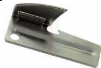
Legendärer P-38 Opener der US Army

Die Kriegslust eines kleinen Korsen mit dem Namen Napoleon Bonaparte machte es notwendig, seine Soldaten mit ausreichendem Essen zu versorgen. Um sie nicht durch Plünderungen ernähren zu müssen, war eine Lösung gefragt, die Nicolas Appert, ein französischer Konditor, lieferte. Er kochte Lebensmittel ein und füllte sie in Flaschen, verschloss diese luftdicht und schon war der Inhalt über lange Zeit haltbar gemacht. Ein Aufenthalt in England regte ihn dazu an, die animalischen und vegetarischen Gerichte in Blechbüchsen zu verfrachten, weil die sich für das Kriegsgeschehen zu Land und zu Wasser besser eigneten. Lediglich das Öffnen der Dosen wurde mit Beilen und großen Messern eher umständlich bewerkstelligt. Der Engländer Robert Yeates entwickelte 1855 den ersten Dosenöffner. Die Armeen waren neuerlich die ersten Abnehmer und wurden damit Wegbereiter für eine neue gigantische Ära in der Konservendosenindustrie. Mittlerweile gibt es eine Vielzahl unterschiedlicher Dosenöffner, die aber durch die Entwicklung des komfortablen Aufreißdeckels ihre Bedeutung langsam aber sicher verlieren.